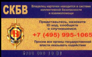
Идентификационная карта (ID-Card)